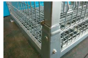
自動ロック機能で安全に組み立てできます