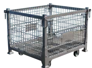
車輪を付ければ手押しで移動可能