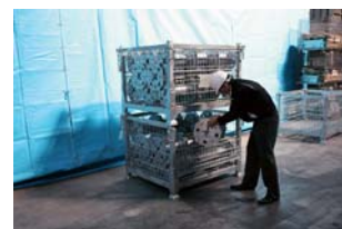
下段パレットの荷物出し入れ可能 (パネルは必ず元に戻して下さい)