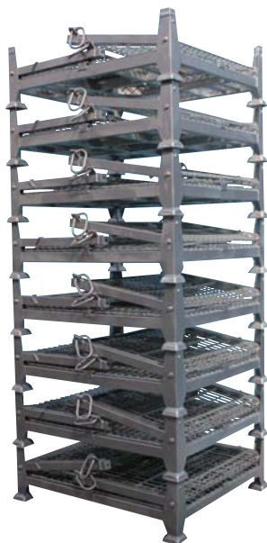
折り畳み時の段積み(8段まで)