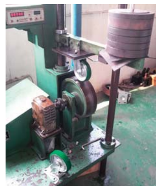
キャスターはJIS B 8922に準じた試験に合格