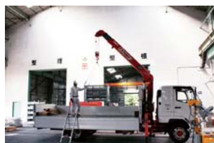
クレーン吊り上げ可能