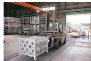
フォークリフト作業可能