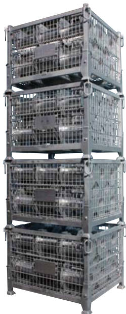
使用時の段積み(4段まで)